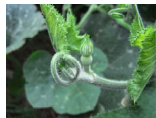
7/14 実がなりそうでしたが、

武蔵村山第八小では、毎日のように栽培委員の子供たちが水やりに来て、愛情いっぱい育てられています。雌花がたくさんついているので、人工授粉を試みるそうです。