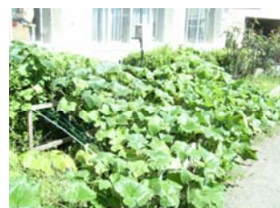
用務さんが、網棚を作ってくださいました