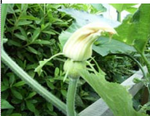
今年は、雌花の花芽がたくさんついてます

武蔵村山第八小では、毎日のように栽培委員の子供たちが水やりに来て、愛情いっぱい育てられています。雌花がたくさんついているので、人工授粉を試みるそうです。