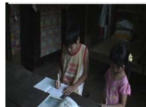
電気は無いので、宿題は明るいうちにすませます