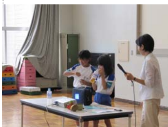
おそろおそろペットボトルのおいをかいでみる

文字が読めないということは、大切な命にもかかわる・・・ということを実感してもらえたようでした。