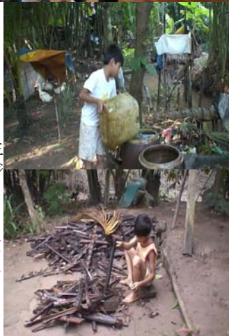
水汲みにそうじと、朝から大忙しのチュック君

次に、1日の生活時間割表を使い、三国北小のみなさんの生活とチュック君の生活の違いを考えました。電気の無い村に住むチュック君は、夜明けと共に起き、宿題は日が沈む前に終わらせて、夜は早寝・・・。また、朝1時間半、夕方2時間、毎日家族の一員として色々な家の仕事もしています。「一番の違いは、お手伝い。三国北小の子どもたちも、2/3以上の子がお手伝いをしていると手を挙げ、その内容を発表してくれました。でも、1日20分程度のお手伝いとは、比較になりません。その時間の長さ子どもたちもビックリ！」(三国北小青木校長先生)