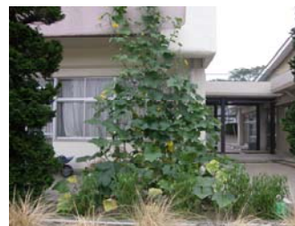
校長室を覆いそうな勢い

横浜市橋幼稚園では、生命力もたくましく、とぐろを巻くように園の畑で育っています。小さな実もなりそうでしたが・・・その後の生育が不調とのこと。がんばれ！かぼちゃん！！