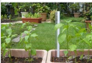
8/16 AEFA 遠藤家にて

宮崎県日南市でも、AEFA正会員大石孝裕さんが、地元の育苗専門家と協力して、なんとか実を生らせようと、大変努力してくださっています！！