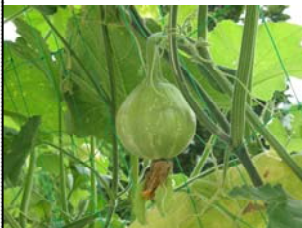
8/24 東館小のかぼちゃ

福島県東館小のかぼちゃは、校長室の窓を覆うように育っています。実も大きい物は10cm弱、その他3個ほど大きくなり始めています。