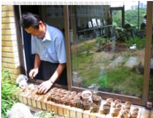
7/7 AEFA 鉢に植え替え

AEFAのとうがらしは水不足で萎れたり幾多の困難を乗り越えて、遠藤専務理事宅の4つのプランターで大事に育てられています。30cmほどに生長しましたが、一向に花がつく気配がないのが気がかりです・・・